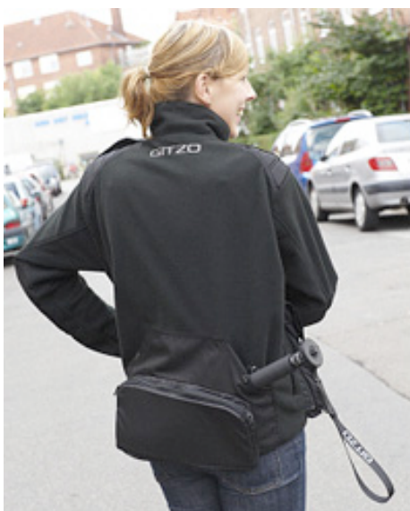
apparel fleece jacket